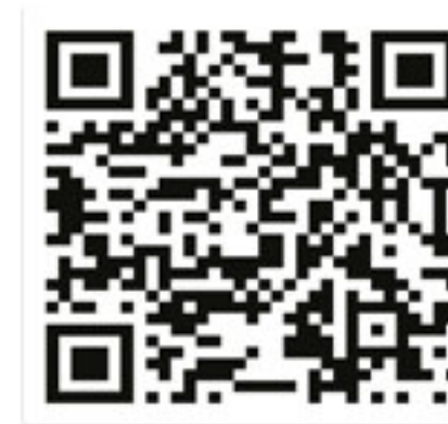
Proceso de admisión