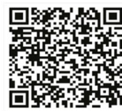
Plan de estudios